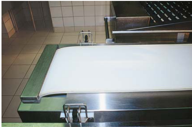
● 3 CT-100 → 101

● Convoyeur à tapis pour vaisselle en vrac et casiers, cellule fin de course