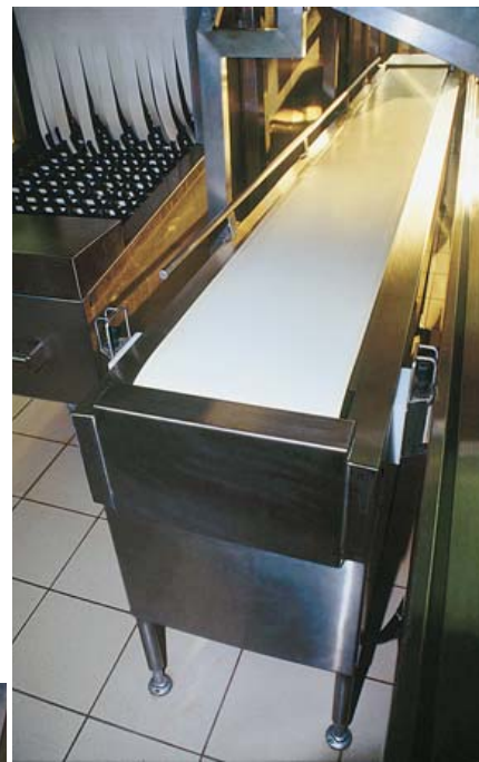
● 3 CT-100 → 101

● Convoyeur à tapis pour vaisselle en vrac et casiers