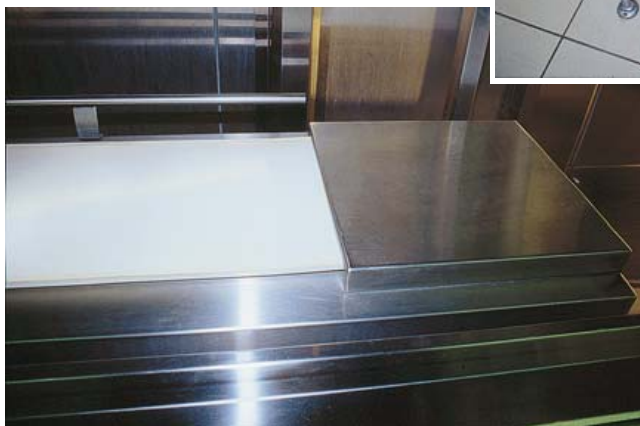
● 3 CT-100 → 101

● Convoyeur à tapis pour vaisselle en vrac et casiers, capot d'extrémité