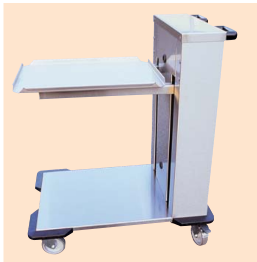
● 5 CHNC-100 → 101