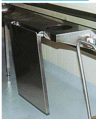
● 5 PNT-100