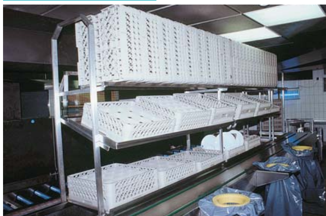
● 5 EG-100 → 103