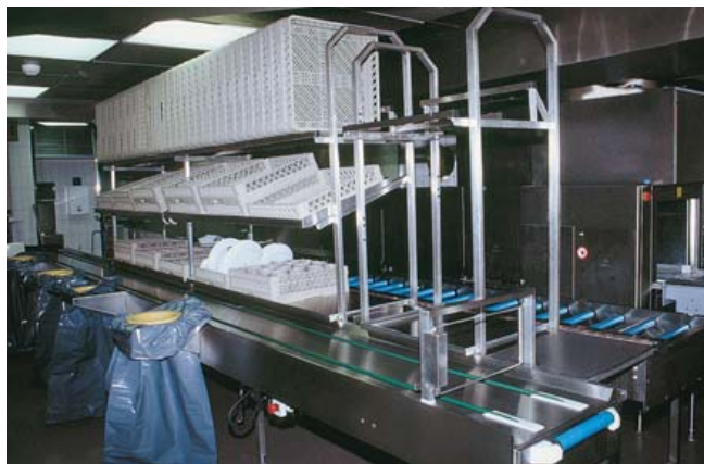
● 5 EG-100 → 103