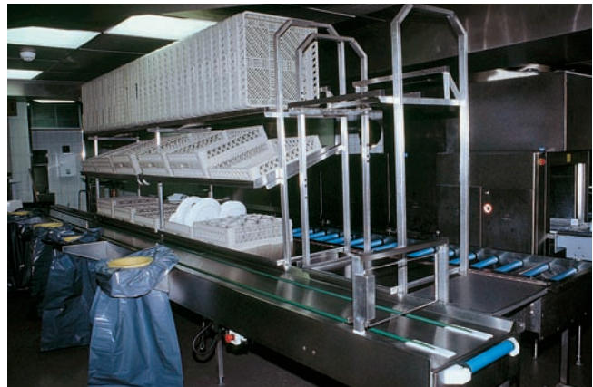
● 5 EG-100 → 103