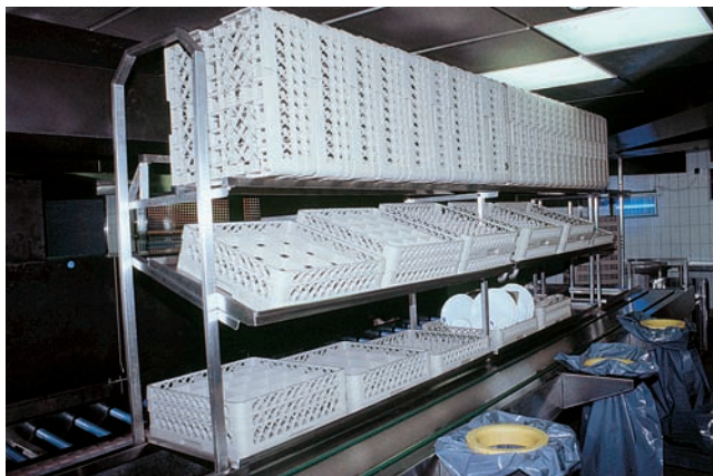
● 5 EG-100 → 103