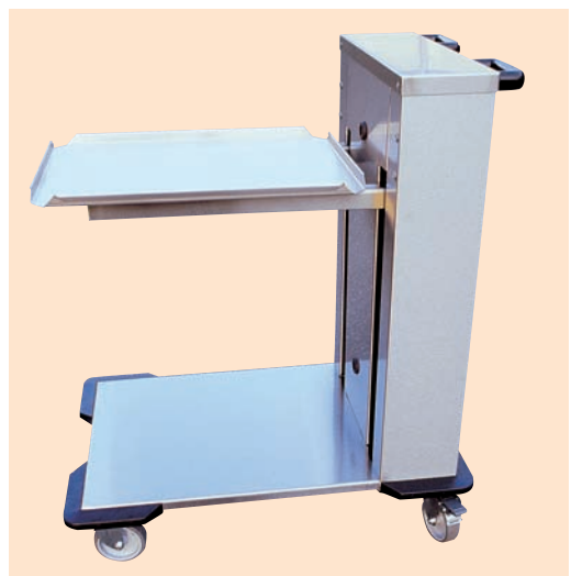
● 5 CHNC-100 → 101