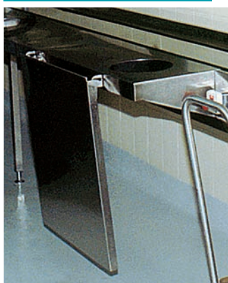
● 5 PNT-100