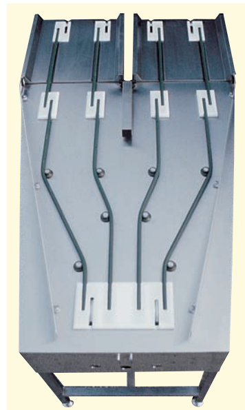
● 1 AIC-100 → 101

● Convoyeur bi-corde, tri avec goulotte intégrée et extracteur magnétique de couverts Cord conveyor, sorting station with integrated waste chute and magnetic cutlery picker