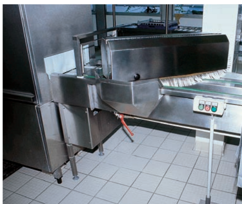
● 1 PN-100 → 101

● Extracteur magnétique de couverts Magnetic cutlery picker