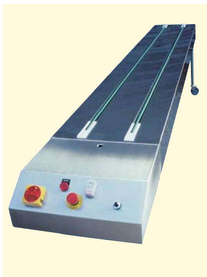
● 1 CCC-100 → 101

● Convoyeur de conditionnement à cordes, détail de la console de commandes Cord type assembly conveyor, integrated control box