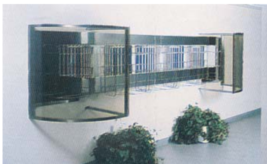
● 1 GM-100 → 103

● Convoyeur de conditionnement à cordes Cord type assembly conveyor