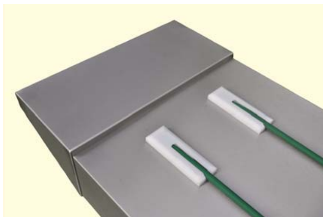
● 1 CCCEVO-100 → 101

● Convoyeur de conditionnement à cordes Tablette côté renvoi Cord conveyor for meal tray assembling drop off area neutral shelf