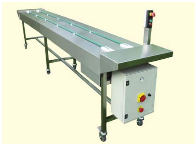
● 1 CCCEVO-100 → 101

● Convoyeur de conditionnement à cordes Cord conveyor for meal tray assembling