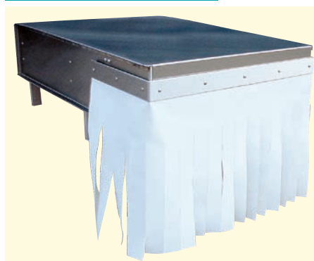
● 1 EMC-100 → 101